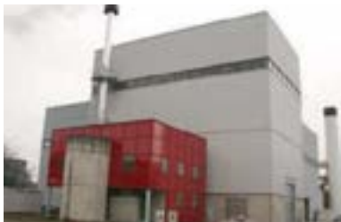
L'ensemble de la chaufferie qui abrite le stockage et la chaudière