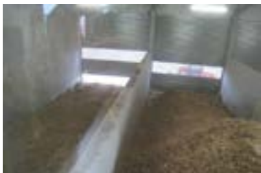
Chaufferie Bois Energie Fromagerie de l'Ermitage