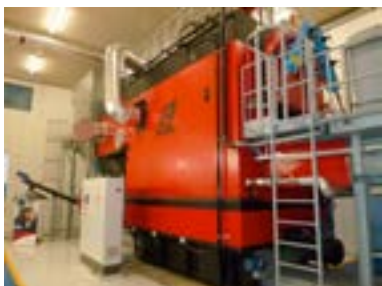
La chaudière bois de 2,9 MW