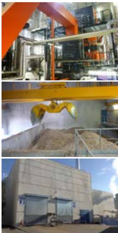
Chaufferie Bois Energie Papeteries Des Vosges (PDV)