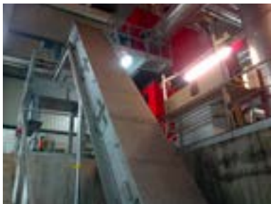
La chaudière et le convoyeur