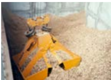
Pont grappin pour transfert automatique de combustible