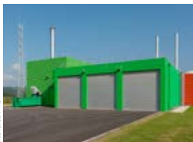
Chaudière bois : vue des trois silos de stockage de combustible et de la benne à cendres