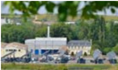
Vue de la chaufferie biomasse et d'une partie des panneaux solaires installés sur le parking de l'usine