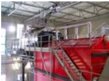
Chaudière biomasse 2