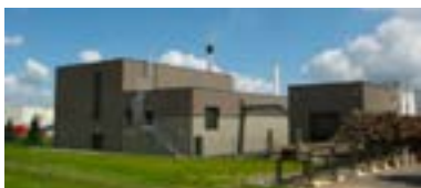
Chaudière bois énergie et unité de broyage Site Laiteries H. TRIBALLAT de Rians

Le soutien de l'ADEME par le Fonds Chaleur (BCIAT 2009) a rendu économiquement acceptable cet investissement conséquent. »