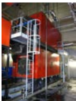
Chaufferie Bois Energie Lactovosges