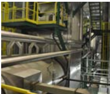
Chaudière SIL – site SAIPOL à Lezoux