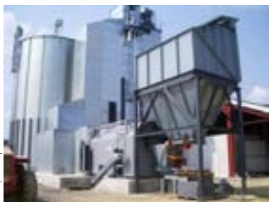
Générateur d'air chaud à biomasse du site de Lescurry