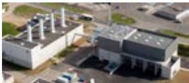
Chaufferie gaz couplée à la chaufferie biomasse