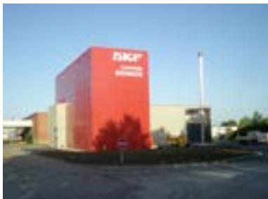
La chaudière bois