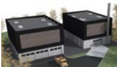
Chaudière biomasse Site Entremont Montauban-de-Bretagne (35)