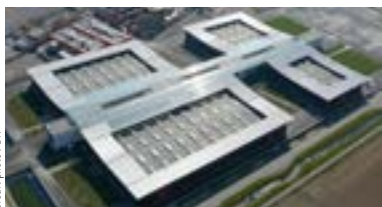
Vue aérienne de l'usine « Joseph Szydowski » de Bordes