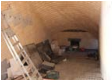
Foyer chaudière bâti in situ brique par brique (1 mois)